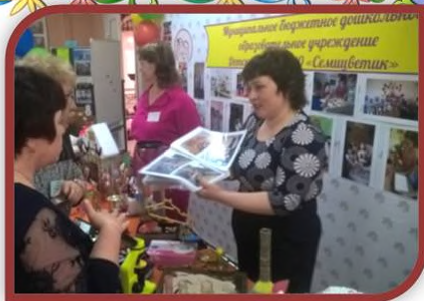
Региональная стажировочная сессия