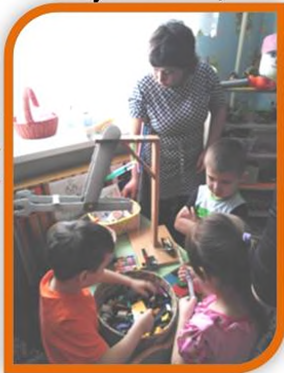
Кран на основе гидравлических подъемников