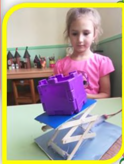
Многоуровневый гидравлический подъемник