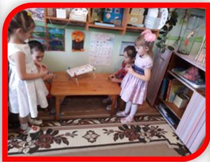
Дидактическая игра «Животные Байкала»