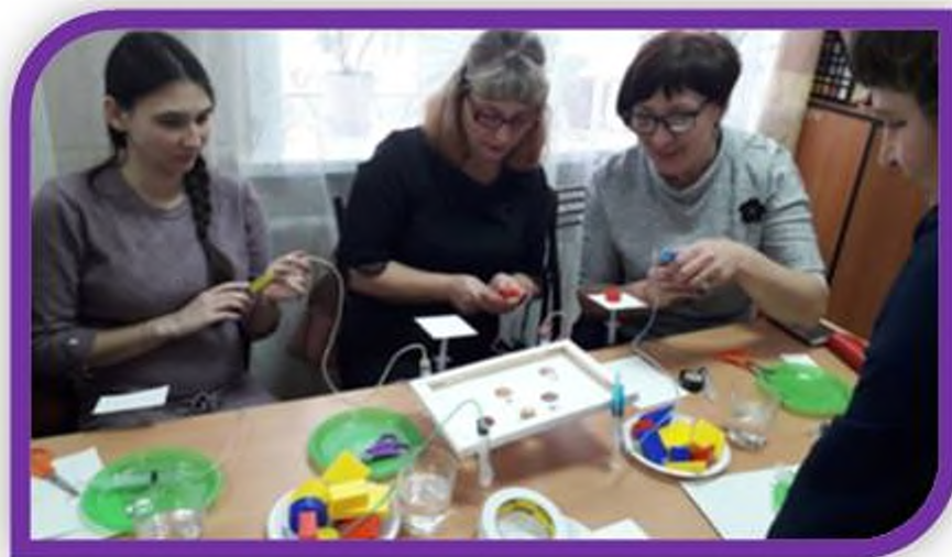
Мастер-класс для педагогов Усольского района